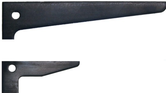
foto: cunei Armo

due; un bloccaggio sicuro (anche in presenza di forti carichi).