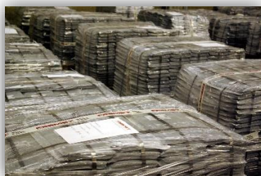
pallet di stoccaggio.